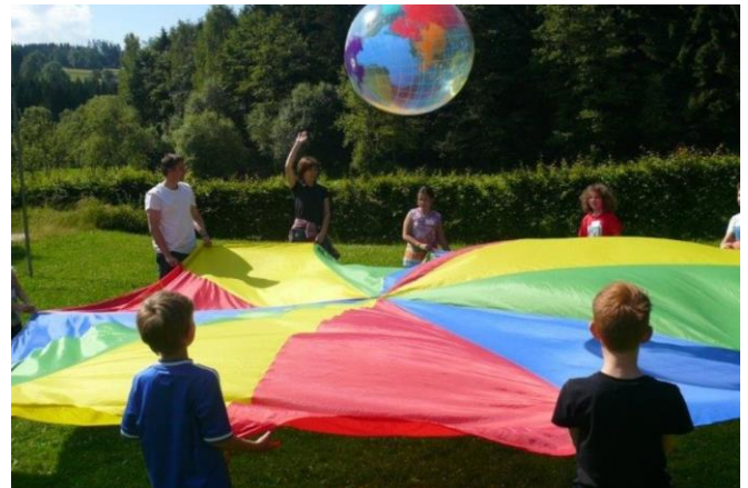
Lese- und Bewegungsfest (14/15)