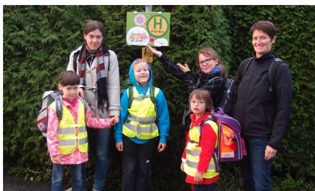
VS Gleisdorf (Stmk)