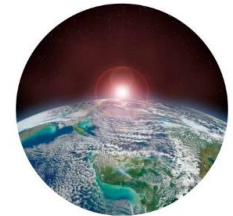
Unterrichtsmaterialien Klima und Energie II

Klima und Energie II (7.-12. Schulstufe): Experiment zu Biogas und Sonnenmühle, Funktion einer PV Anlage, energy crossword auf Englisch, Durchschnitts-Stromverbrauch, Energieverbrauch nach Sektoren