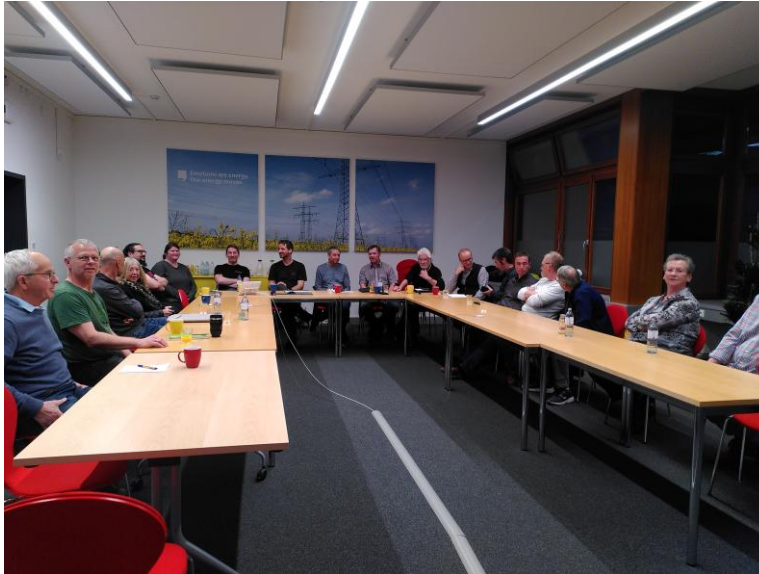
Reparaturnetzwerktreffen März 2026