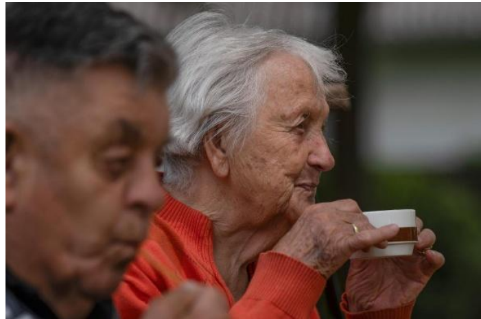
Jausen-Station mit Kaffee