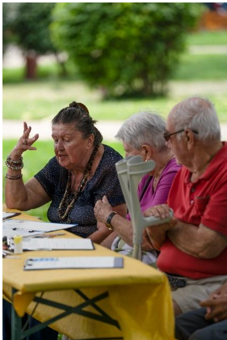
Diskussion zu Steckbrief

Steckbriefe kamen zum Einsatz, um digitale Technologien und bestehende Lösungsansätze vorzustellen und zu bewerten hinsichtlich der Nützlichkeit für die Lebenssituation der Zielgruppen. Sie enthielten kurze Beschreibungen und Bilder, worum es bei dem Lösungsansatz bzw. der digitalen Technologie geht. Die Teilnehmer:innen konnten dann mithilfe von Klebepunkten ihre Bewertungen direkt auf den Steckbriefen anbringen. Die Steckbriefe gaben uns auch Feedback zu den Prioritäten und Bedürfnissen der Teilnehmer:innen.