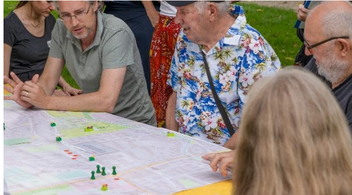
PARADIES Spiel