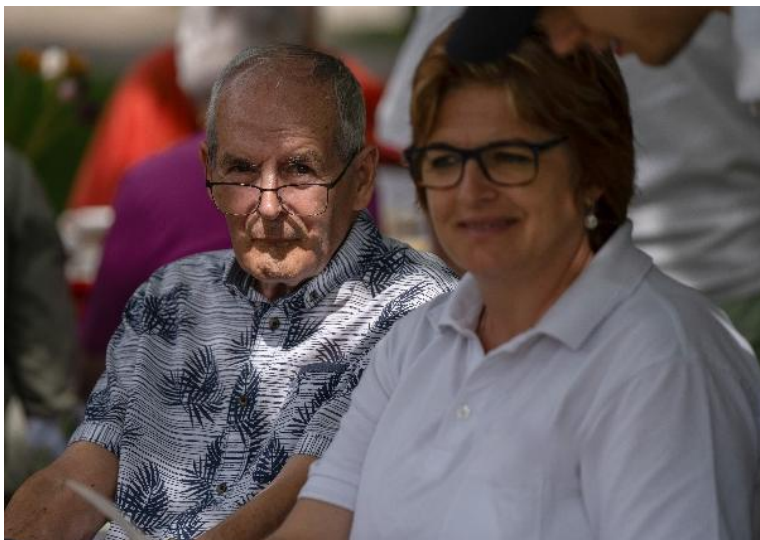
Selbstständig und eingebunden alt werden als Ziel

Dabei gilt: Das Rad muss nicht neu erfunden werden. Vieles ist bereits vorhanden und kann gezielt weiterentwickelt werden.