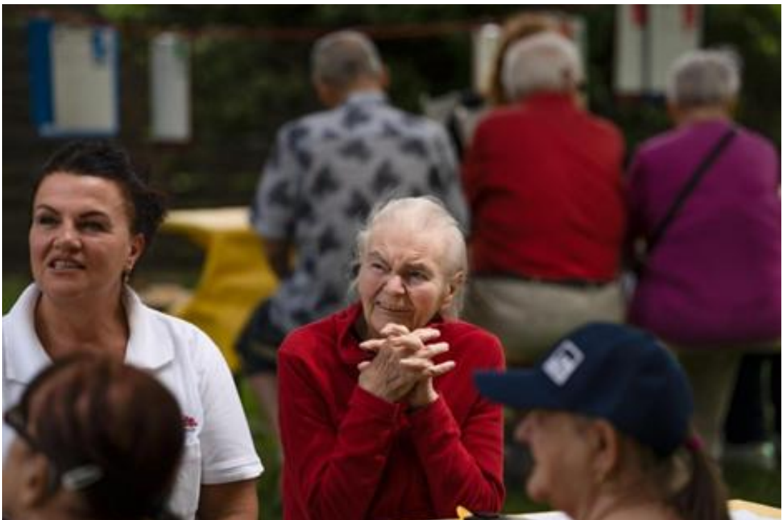
Eingebunden sein bei Lösungsentwicklung