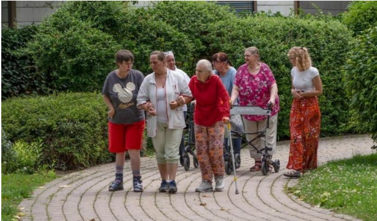
Gemeinsamer Weg zur Umsetzung, Foto: T. Werchota

Praktische Instrumente aus dem Projekt „PARADIES“ wie eine Fragebogen-Vorlage oder Maßnahmensammlung stehen auf der Webseite zur Verfügung: