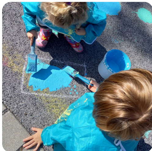
Kinderhaus am Straßenglerberg 2023